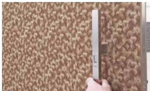
Haustürdeck einer in Sublidot ausgearbeiteten MDF-Oberfläche – gezeigt bei Schörghuber

Vertretung in Deutschland: Thomas Wolfs – Ingenieurbüro www.tw-i.info