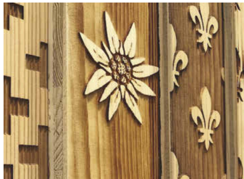
Klassische schweizerische Motive wie das eidgenössische Kreuz oder Edelweiß auf Fichte-Dreischichtplatte gelasert