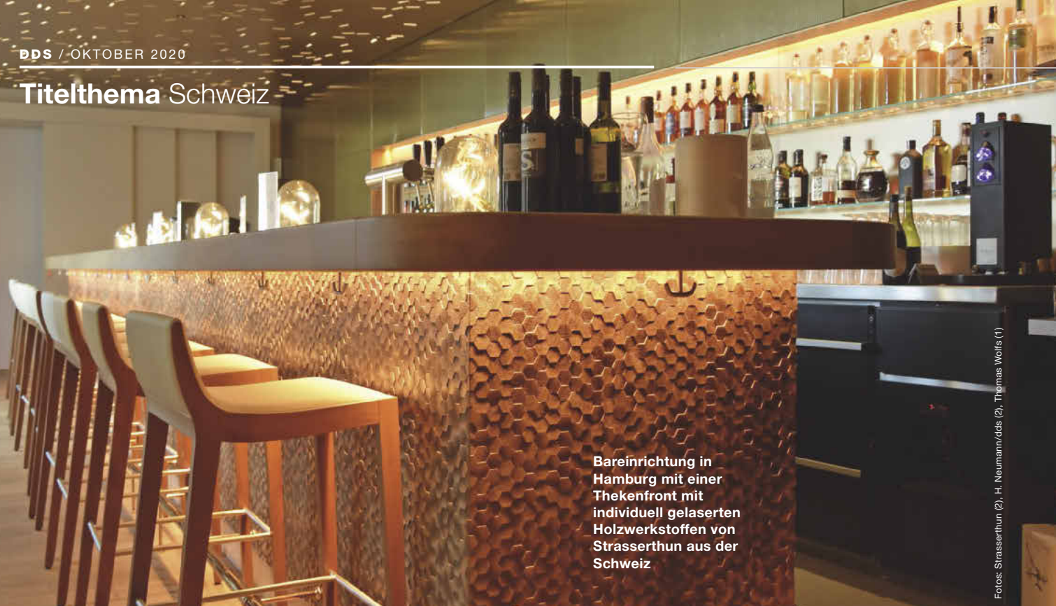
Bareinrichtung in Hamburg mit einer Thekenfront mit individuell gelaserten Holzwerkstoffen von Strasserthun aus der Schweiz