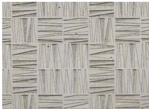
Sublimation auf grauem C-Beton nach Entwürfen von Designer Pierre Mazairac